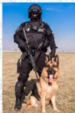
Немецкая овчарка (розыскник, спасатель, телохранитель)