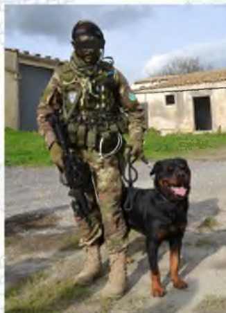
Ротвейлер (розыскник, телохранитель)