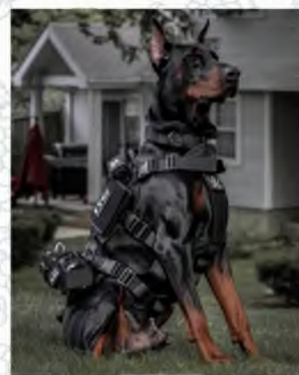
Доберман (розыскник, охранник)