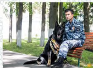
Восточно – европейская овчарка (розыскник, телохранитель)