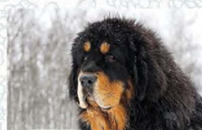
Тибетский мастифф (охранник)