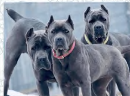
Кане – корсо (охранник)