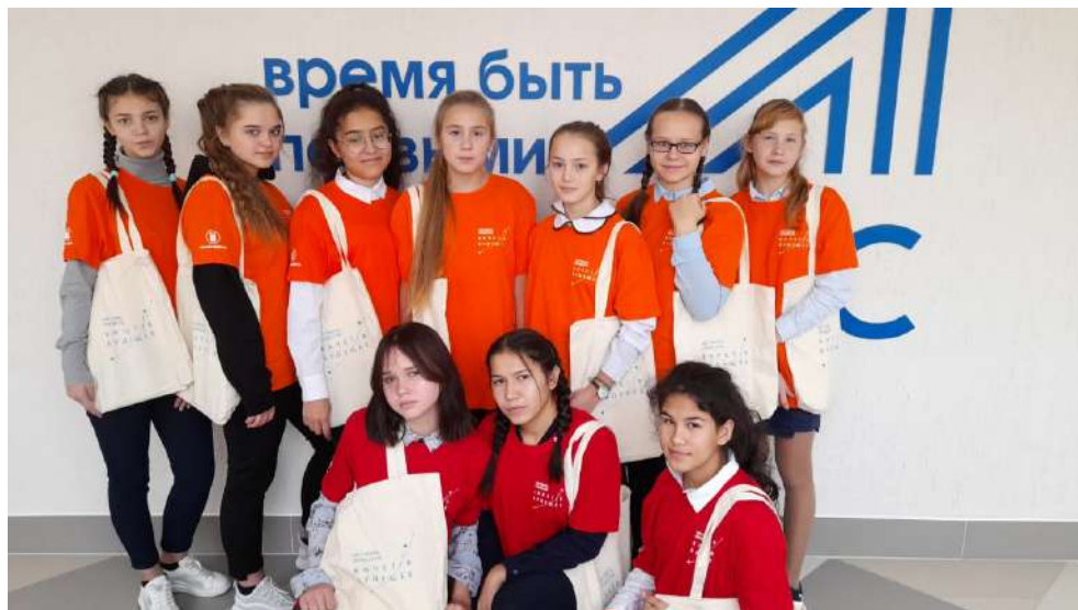
МБОУ «Ягуновская СОШ» Кемеровский МО