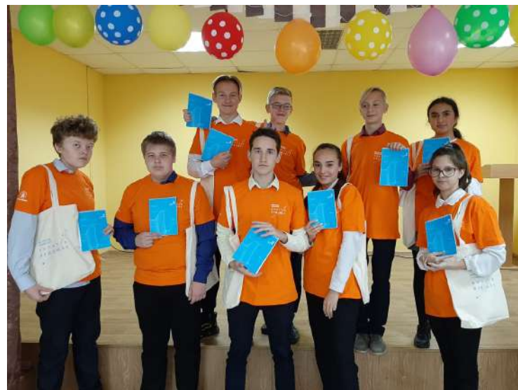
МБОУ «Маталлплощадская СОШ» Кемеровский МО